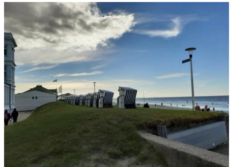
Links im Bild: Haus am Weststrand – nur die Promenade trennt es vom Strand und dem Meer -