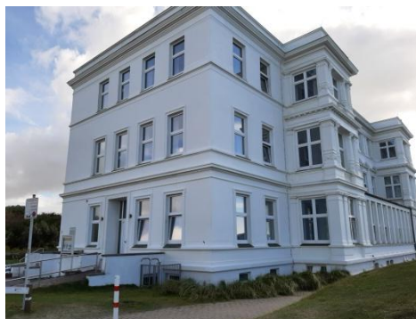
Die Zimmer befinden sich im 2. OG, ein Teilkontingent meerseitig; 2022 saniert