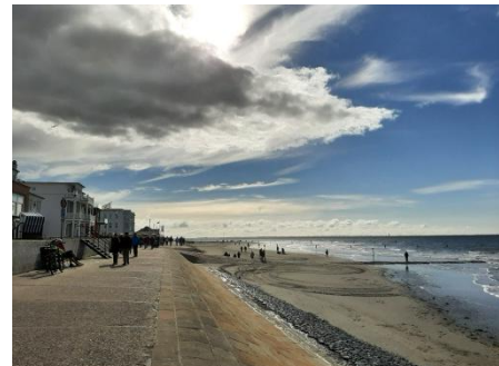
Im Hintergrund vorspringend, das historische „Haus am Weststrand“; davor ☞ die Bar am Weststrand und direkt daneben die „Giftbude“; - angesagtes Restaurant mit Meerblick -

- November 2025 | 02.-06.11.2025 auf NORDERNEY im „Haus am Weststrand“ | 10 Zimmer, davon 4 mögl. DZ - Birgit Emmerich – Mediatorin, Coachin | 0176 41799546 | emmerich@geomediat.de Anmeldung per Email unter Nennung von „NYV1“ bis spätestens 09.09.2025 | 8-12 Teilnehmer*innen Gesicherte Seminarszusage ☞ nach Zahlungseingang der Seminargebühr | Rechnung per Email nach Ihrer Anmeldung