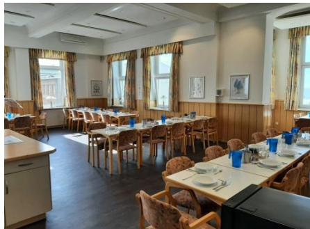
Speisesaal mit Blick auf's Meer Frühstücks- & Abendbuffet, 8-10h bzw. 18h Mittagessen - am Tisch serviert - um 13h