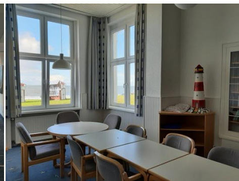
Das Lesezimmer – Seminarraum für 10 Personen mit Blick auf's Meer