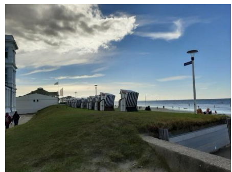
Links im Bild: Haus am Weststrand – nur die Promenade trennt es vom Strand und dem Meer -