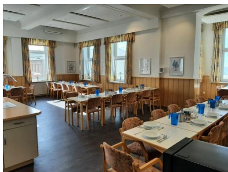
Speisesaal mit Blick auf's Meer Frühstücks- & Abendbuffet, 8-10h bzw. 18h Mittagessen - am Tisch serviert - um 13h