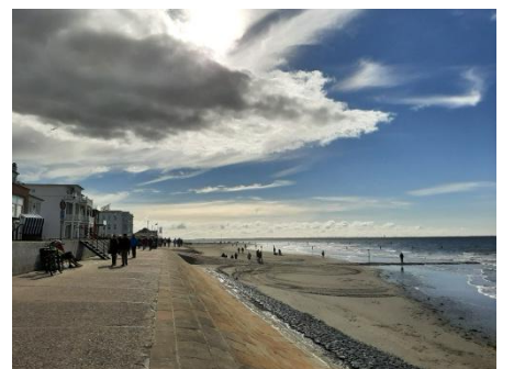
Im Hintergrund vorspringend, das historische „Haus am Weststrand“; davor liegt die Bar am Weststrand und direkt daneben die „Giftbude“, das angesagte Restaurant mit Meerblick

- Weitere Termine sind frühestens für November 2023 auf NORDERNEY im „Haus am Weststrand“ zu buchen -